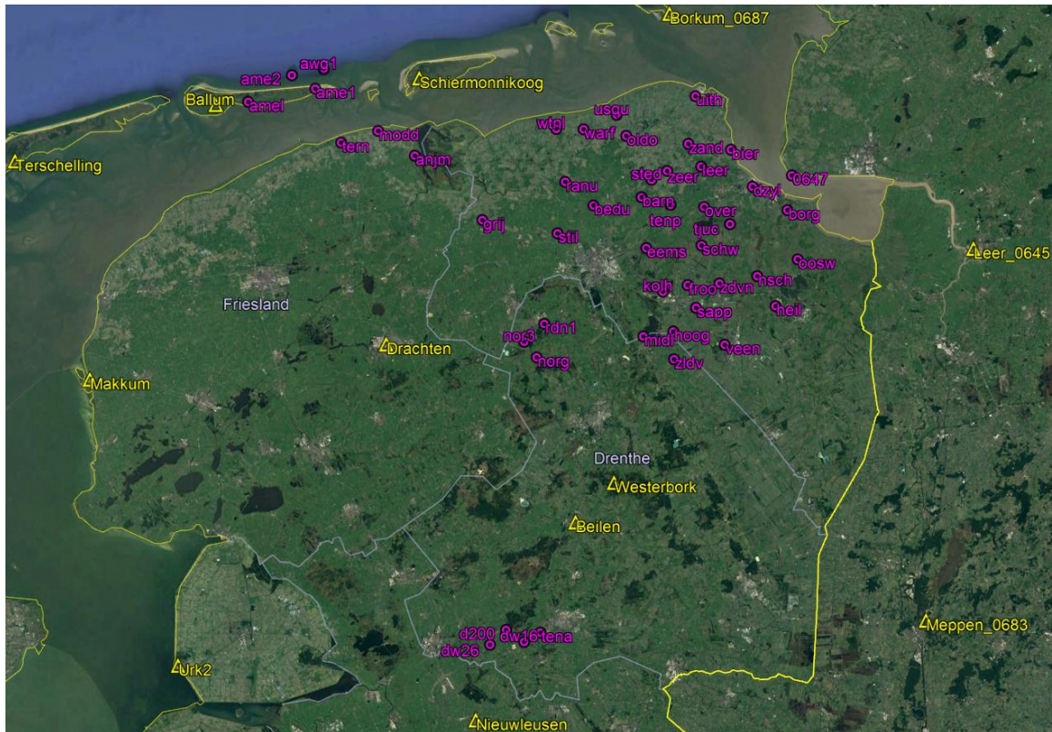
Overzichtskartaal alle GPS-referentiestationen (geel) en GPS-monitorstations (paars).

In de grafieken op de volgende bladzijden zijn de continue GPS-metingen op 4 locaties rondom De Wijk weergegeven.